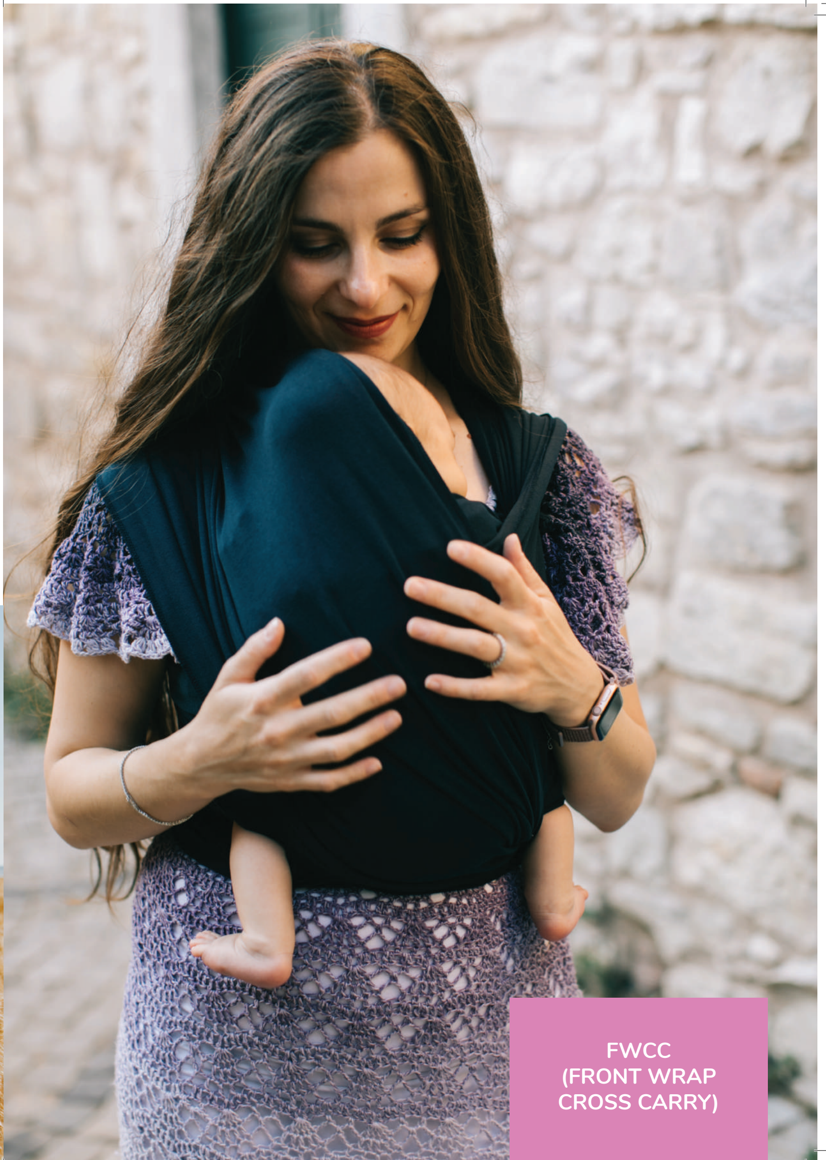
FWCC (FRONT WRAP CROSS CARRY)